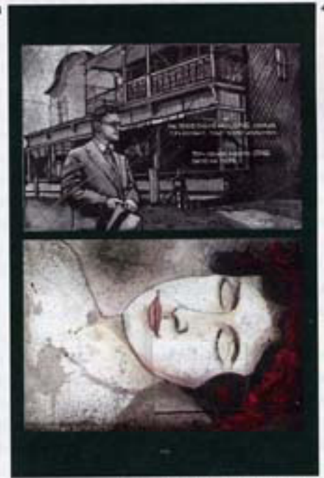
La couverture du Projet Outaouais [ 1 ] Le monstre du Lac Blue Sea, une illustration de St-Georges [ 2 ] Illustration de Marie-France Thibault inspirée de Kitigan Zibi/Maniwski [ 3 ] Illustration de Christian Quesnel [ 4 ]